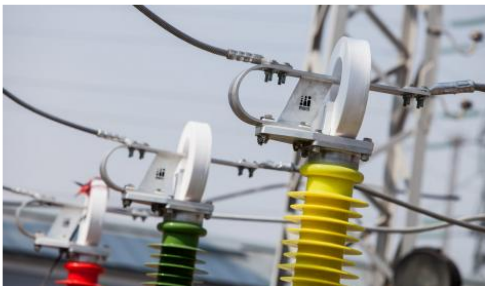
写真。プロモテック

ました - 測定トランスの検証と校正のためのモバイルエキスパートシステム。国際的な会社KEMAは、世界のメーカーの製品の認証試験を実施し、標準Profotechとその研究所を装備しています。