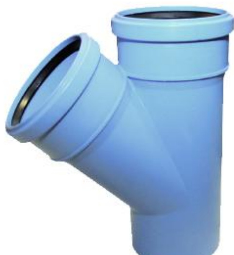
Foto: Sistemas de drenagem interna

Sinicon Rain Flow - tubos e acessórios para caleiras internas de edifícios de até 100 metros de altura.