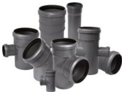
Foto: Sistema de esgoto interno de polipropileno