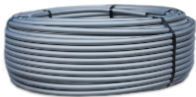
Foto: Tubo para aquecimento a baixa temperatura, abastecimento de água e sistemas de aquecimento de piso aquecido com água

Os produtos SINIKON têm uma série de vantagens inegáveis sobre os sistemas feitos de materiais tradicionais (ferro fundido) e sistemas feitos de outros materiais poliméricos (policloreto de vinilo não plastificado e polietileno):Excelente qualidade: os produtos são fabricados de acordo com a norma europeia EN 1451 e GOST 32414-2013 standart em equipamentos profissionais alemães e italianos;Os maiores produtores de polipropileno são fornecedores directos de matérias-primas: SIBUR Holding, Nizhnekamskneftekhim;Controlo de qualidade multinível: desde a entrada de matérias-primas e componentes, passando pelo controlo de qualidade de linha, até ao controlo de qualidade de saída dos produtos acabados;Foram utilizados tubos e acessórios Sinicon para completar as instalações olímpicas em Sochi, incluindo o Palácio do Gelo Bolshoy e a Aldeia Olímpica;Infra-estrutura do armazém: para responder prontamente às solicitações dos clientes, a fábrica SINIKON dispõe de um amplo e espaçoso armazém com estoque permanente;Cada assunto da Federação Russa dispõe de pelo menos um ou vários distribuidores oficiais com os estoques de armazém necessários para a pronta conclusão de instalações de qualquer complexidade.