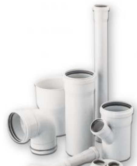
Foto: Sistema de esgoto interno com baixo nível de ruído