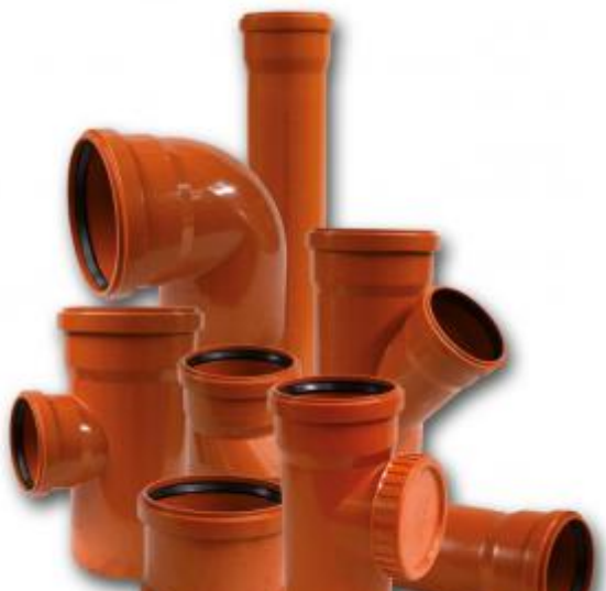
Foto: Sistema de esgoto externo

Sinicon Universal - tubos e acessórios para sistemas de esgotos externos.